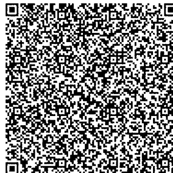
Tabela de Custas: Certidão - 2026

Selo Digital: 1114923C30000001218590266 https://selodigital.tjsp.jus.br